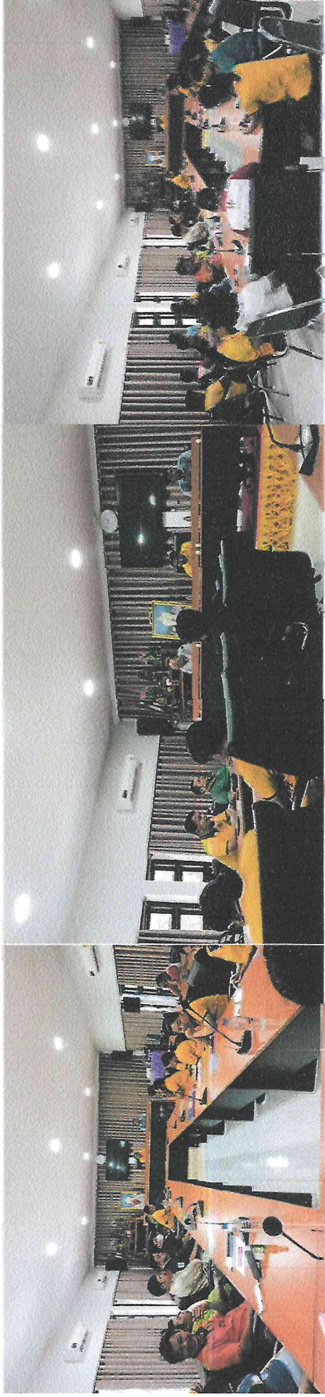
เมื่อวันที่ 16 กุมภาพันธ์ 2569 องค์การบริหารส่วนตำบลนาเชือก